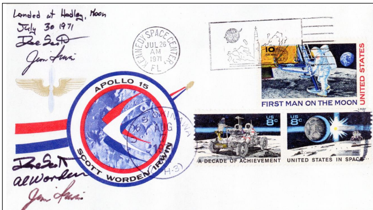
Un sobre “sieger” preparado por los astronautas de la NASA David Scott, James Irwin y Alfred Worden.