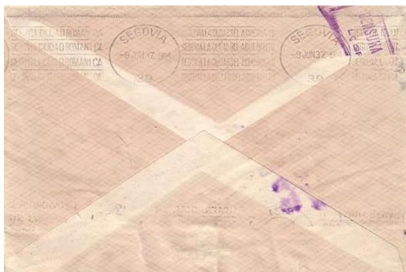
Fig. 13: Reverso del sobre anterior. Fechador rodillo de llegada «SEGOVIA / 9JUN37. 9M / (39)» y marca de la censura militar de Logroño en color violeta, Heller L27.