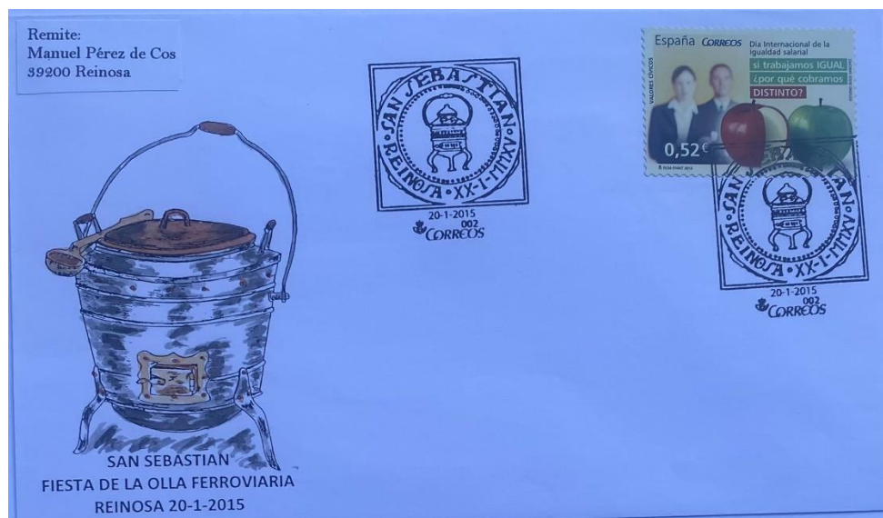
Sobre conmemorativo de la exposición filatélica dedicada a la olla ferroviaria

El cancelador, emitido el 17 de septiembre de 2010, muestra el perfil de una de estas ollas, rodeado por las leyendas alusivas al mismo.