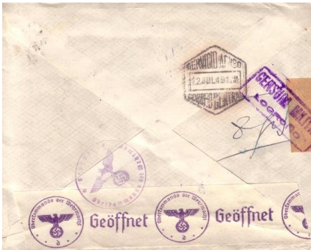
Fig. 15: Reverso. Marca de tránsito del Servicio Aéreo del Correo Central, fechador hexagonal 12 JUL 40. 1 M. Anotado su peso en el reverso, 8 g. Cierre con etiqueta de censura y marca de la censura militar de Logroño, Heller L27.3 c. en color violeta. La censura alemana la abre de nuevo, inspecciona y cierra con una etiqueta especial y aplica una marca en color rojo de censura.