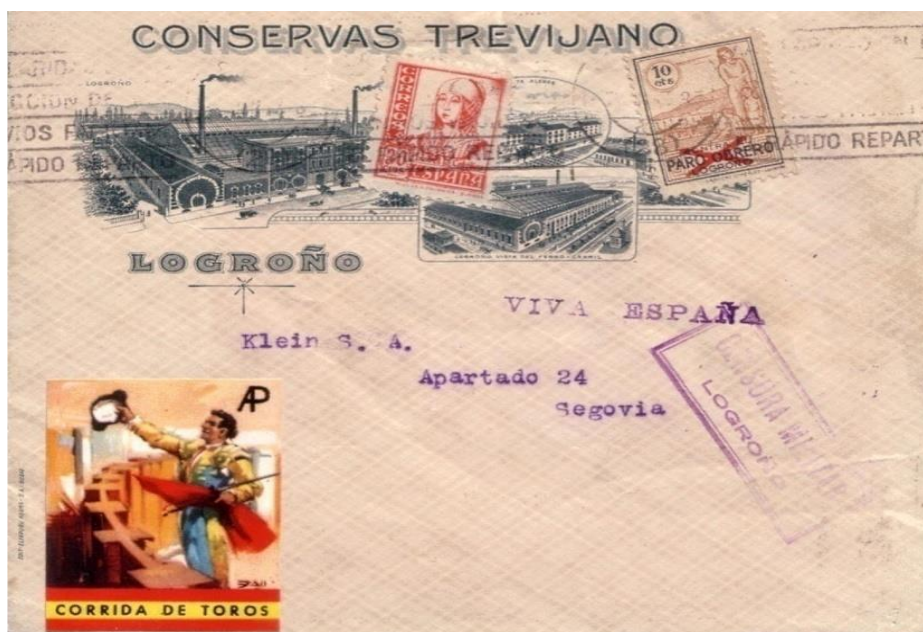
Fig. 12: Junio 1937. Sobre circulado de Logroño a Segovia, con sello de 30 cts. de Isabel II, emisión 5.1.1937, tarifa del 1.08.1931 a julio 1938; y sello emisión local de sobrecarga o recargo 1936-1939 «CONTRA EL PARO OBRERO», con pie de imprenta "Gráficas González Logroño" de 10 cts., inutilizados con matasellos de rodillo ilegible y marca de Censura Militar de Logroño en color violeta, Heller L27.

Por último, en la década siguiente siguió utilizando sobres comerciales publicitarios para su correspondencia con la misma imagen de sus tres fábricas más importantes.